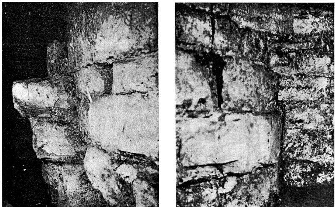
Fig. 2-3- Alba Iulia. Rotonde. Appareil exécuté en «opus quadratum».