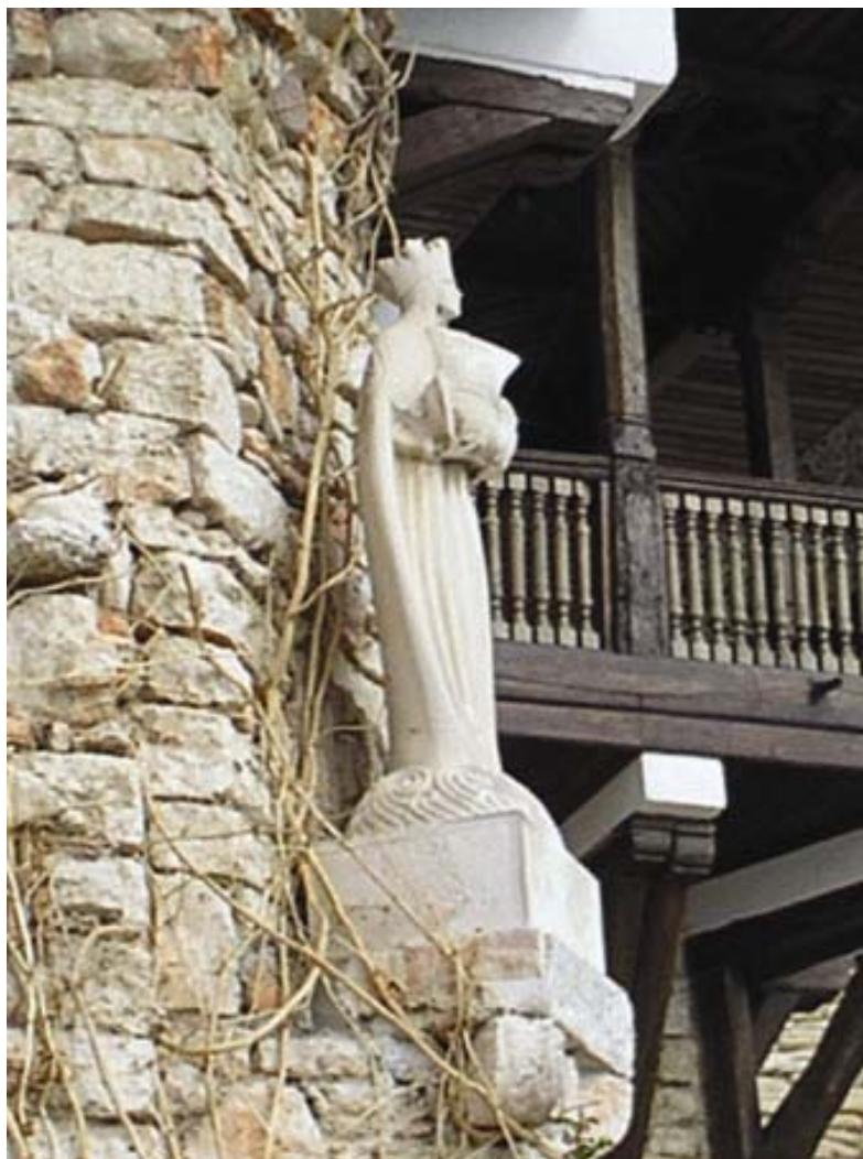
Fig. 9. Fecioara Maria protectoarea mărilor, calcar de Dobrogea, către 1933.

Din aceeași perioadă (1935) datează portretul primului său copil, Arhiducele Ștefan (cat. 10; fig. 10), în chipul căruia citim constanta preocupare a sculptoriței pentru viața interioară a modelelor sale. Lucrarea denotă și o mai mare libertate de expresie în modelarea volumelor.