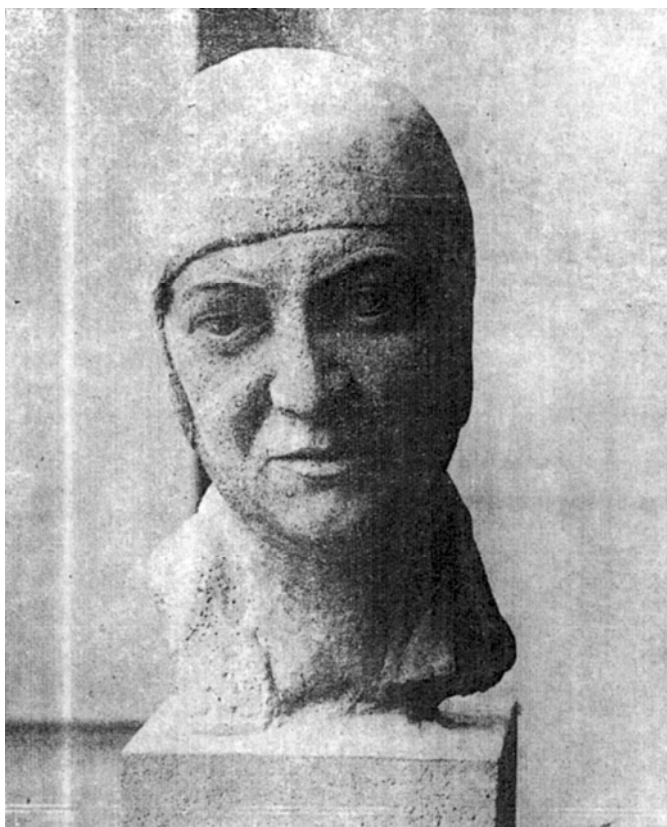
Fig. 8. M-elle de Lantillon , bronz, 1932, Ilustrațiunea Română , 20 ianuarie 1932, p. 3.

către 1933 la solicitarea mamei sale, ca o încununare a edificării vilei regale Tenha Yuvah ( Cuibul liniștit ). Statuia Fecioarei Maria ca protectoare a mărilor era o dovadă a atașamentului pe care domnița îl avea pentru Balcic 37 .