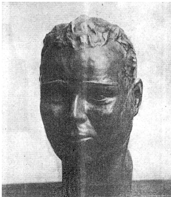
Fig. 4. Portret de tânăr , bronz, 1930, Ilustrațiunea Română , 20 februarie 1930, p. 10.

a căror tipologie amintește de ciclurile similare ale lui Dalou, aflate în patrimoniul Musée de la Ville de Paris.