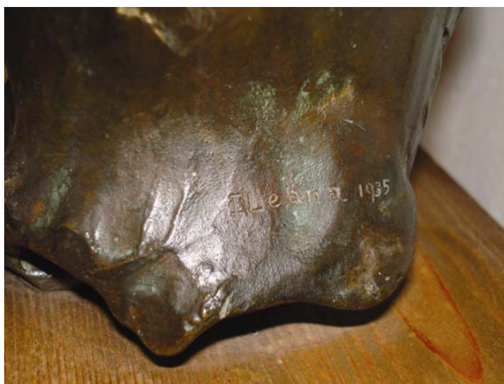
Fig. 11. Detaliu semnătură, 1935.