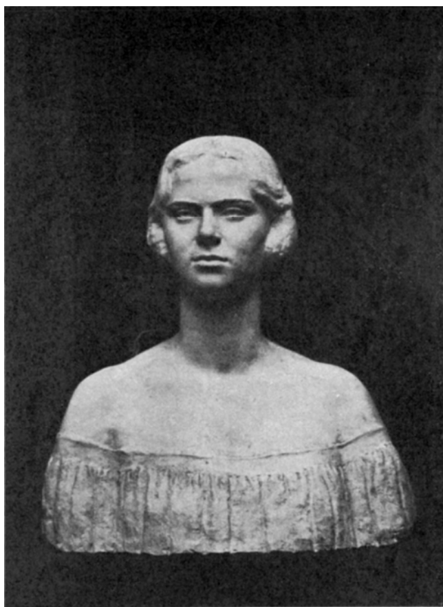
A. S. R. Principesa Ileana

adolescentină și nu lipsită de prestanță o încadrează în schema busturilor florentine din Quattrocento. Printr-un exercițiu de stil, sculptorul adaptează limbajul clasicismului modern, dar și al observației realiste pentru chip, la o formulă compozițională consacrată.