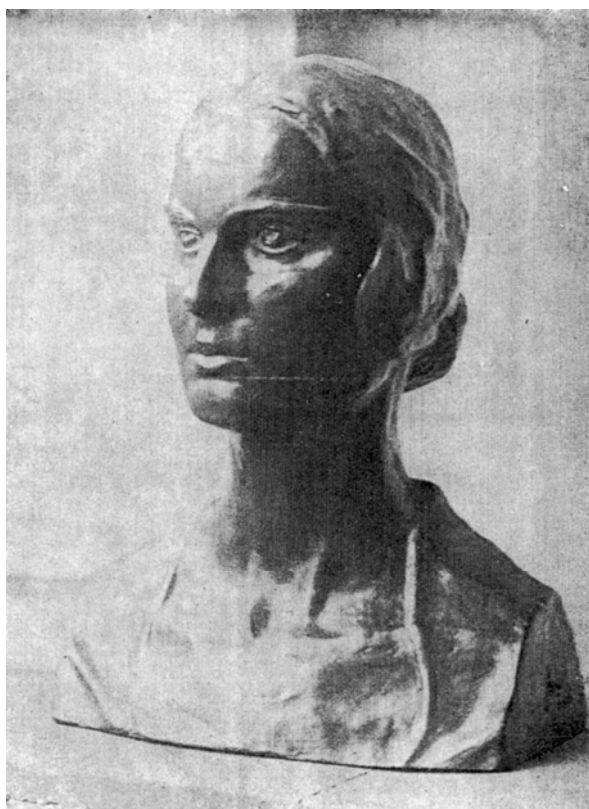
Cap de tânără fată, sculptură de A. S. I. Arhiducesa Ileana

Cea de a doua și ultima expoziție la care participă Domnița Ileana, devenită între timp arhiducesă de Austria, are loc în foaierea teatrului Maria Ventura, în ianuarie 1932. Cele două sculpturi ale domniței (cat. 8, 9) sunt prezentate în vecinătatea picturilor surorii sale Elisabeta, regina Greciei. Este vorba despre două portrete feminine, un Cap de fată , poate un autoportret 35 (fig. 7) și M-elle de Lantillon (fig. 8), efigii realiste, expresive, în care interesul sculptoriței pentru psihologia proprie fiecărui personaj este evident.