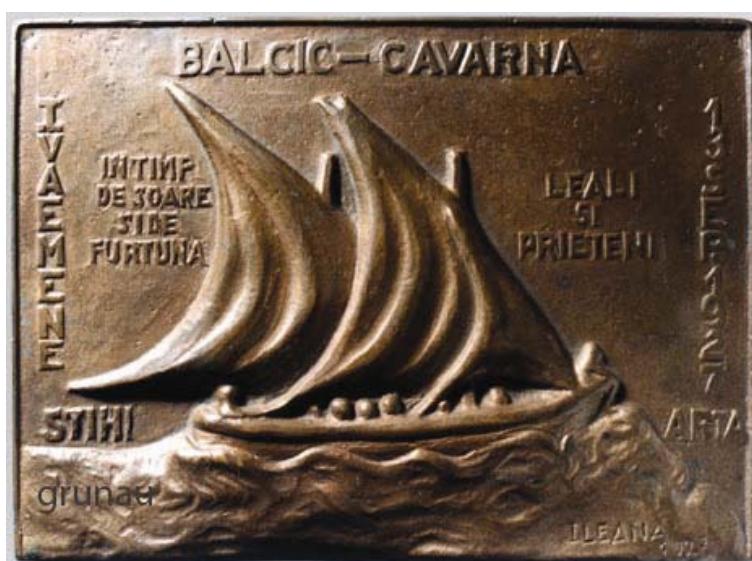
Fig. 3. Placheta Balcic-Cavarna, alamă, 1927, colecție particulară