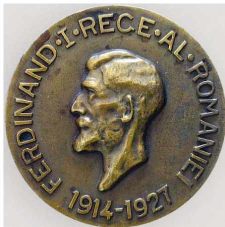
Fig. 2. Medalia comemorativă Regele Ferdinand , bronz, 1927, foto col. Ruxanda Beldiman.