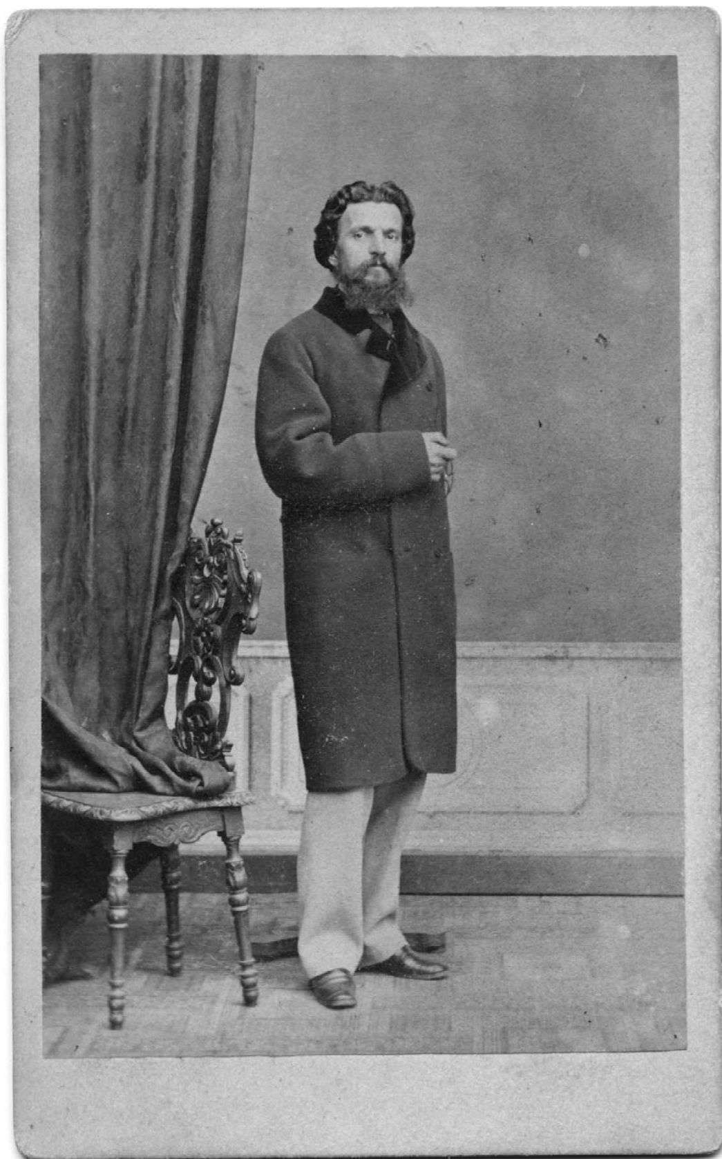
Fig. 1. Pictorul Theodor Aman, atelier Photographie parisienne , Calea Mogoșoai N° 78, lângă Piața Episcopiei, București, colecția Mihai Sorin Rădulescu.