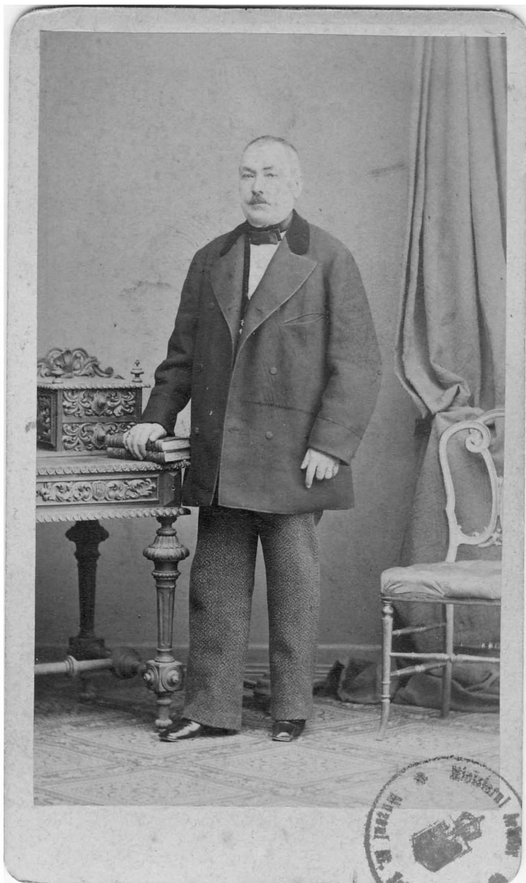
Fig. 4. George D. Aman, Photographie des Grands Magasins du Louvre, Paris , Biblioteca Națională a României, Colecții Speciale, Cabinet Fotografii.