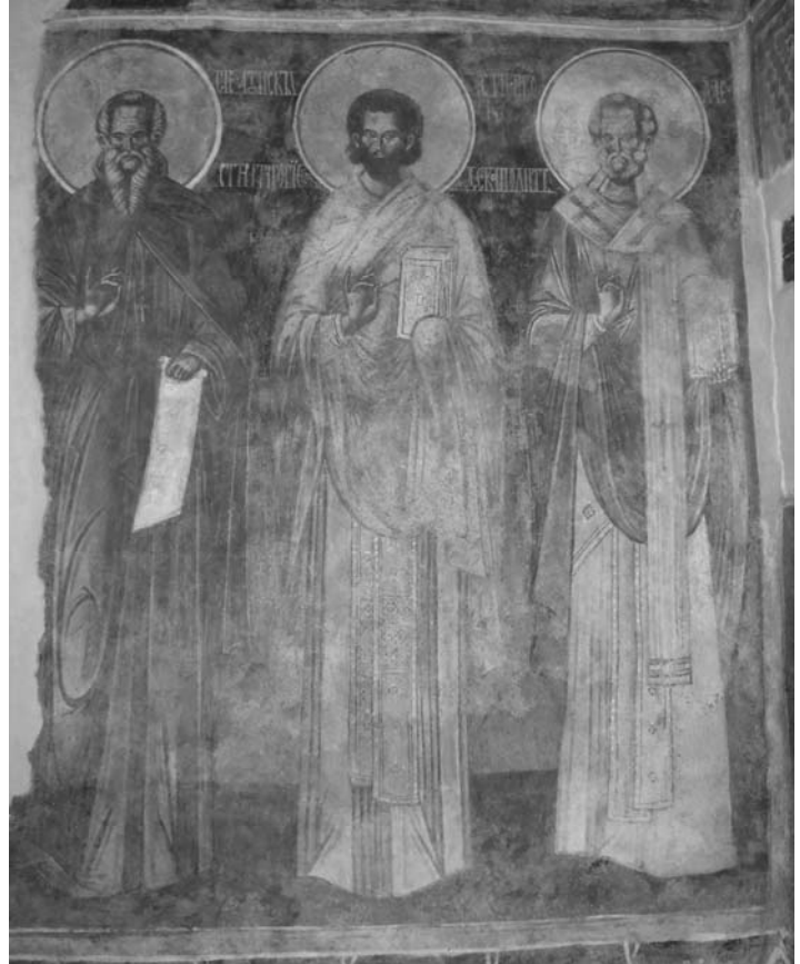
Fig. 24. Sf. Atanasie Atonitul, Grigore Decapolitul, Nicolae, naos N.