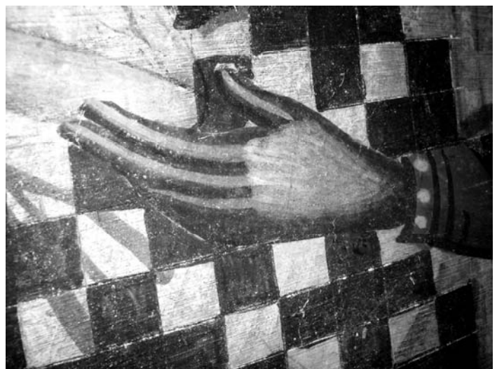
Fig. 11. Sf. Spiridon, detaliu.