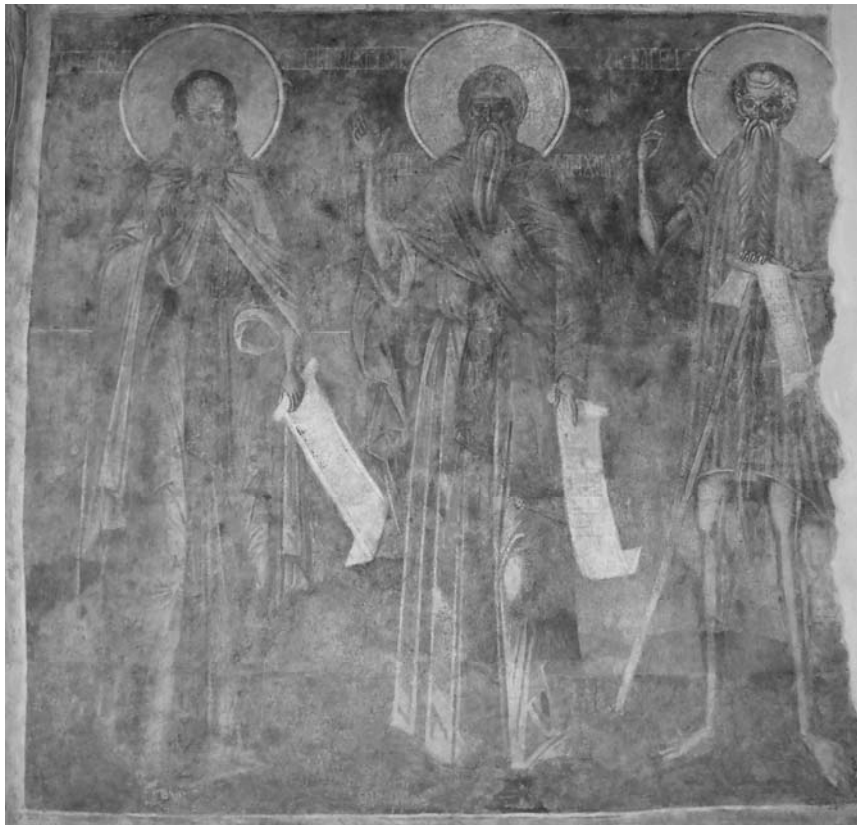
Fig. 23. Sf. Teodosie Chinoviarhul, Pahomie, Pavel Tebeul, naos V.