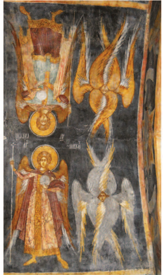
Fig. 15. Arhangeli și serafimi, bolta naosului spre E.