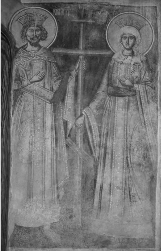
Fig. 22. Sf. Împărați, naos V.