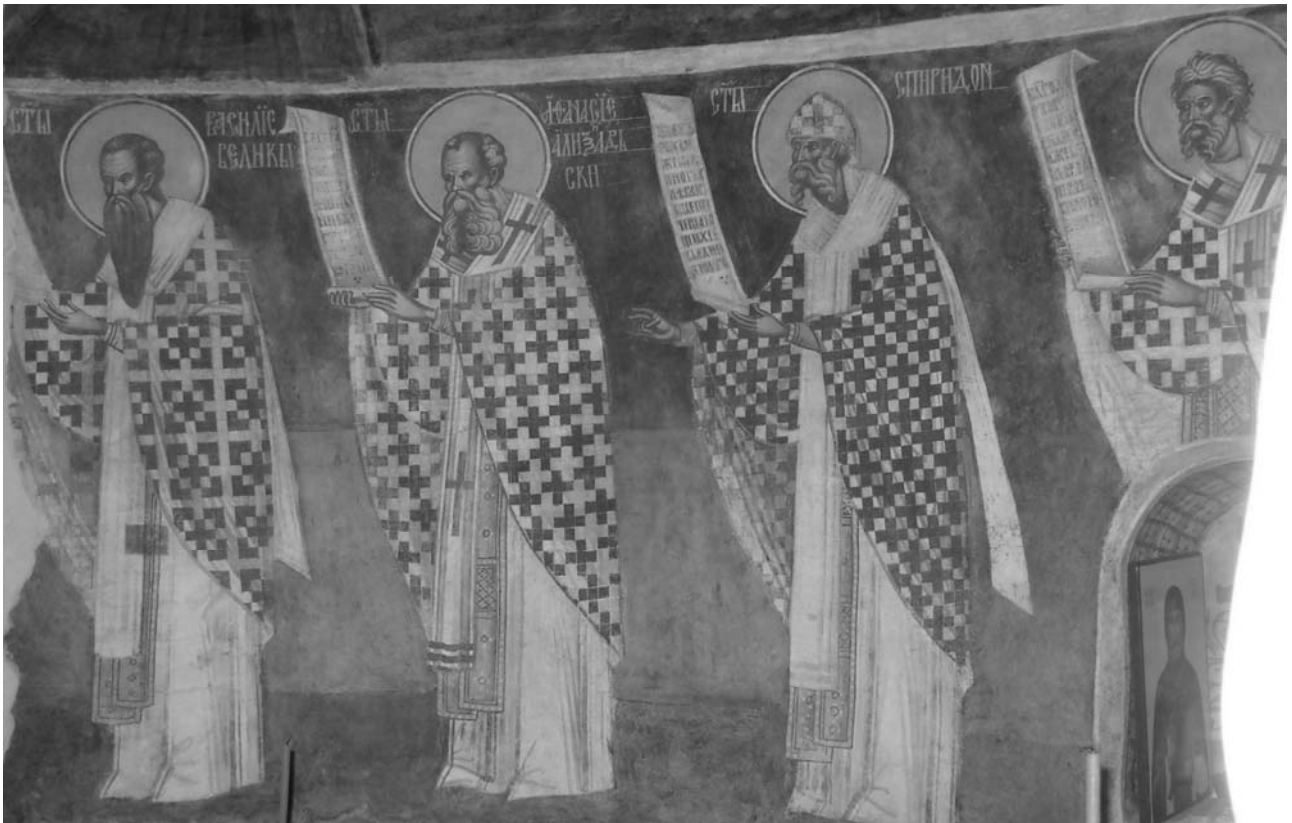
Fig. 8. Sf. Vasile, Atanasie, Spiridon, ierarh fără nume, altar, S.