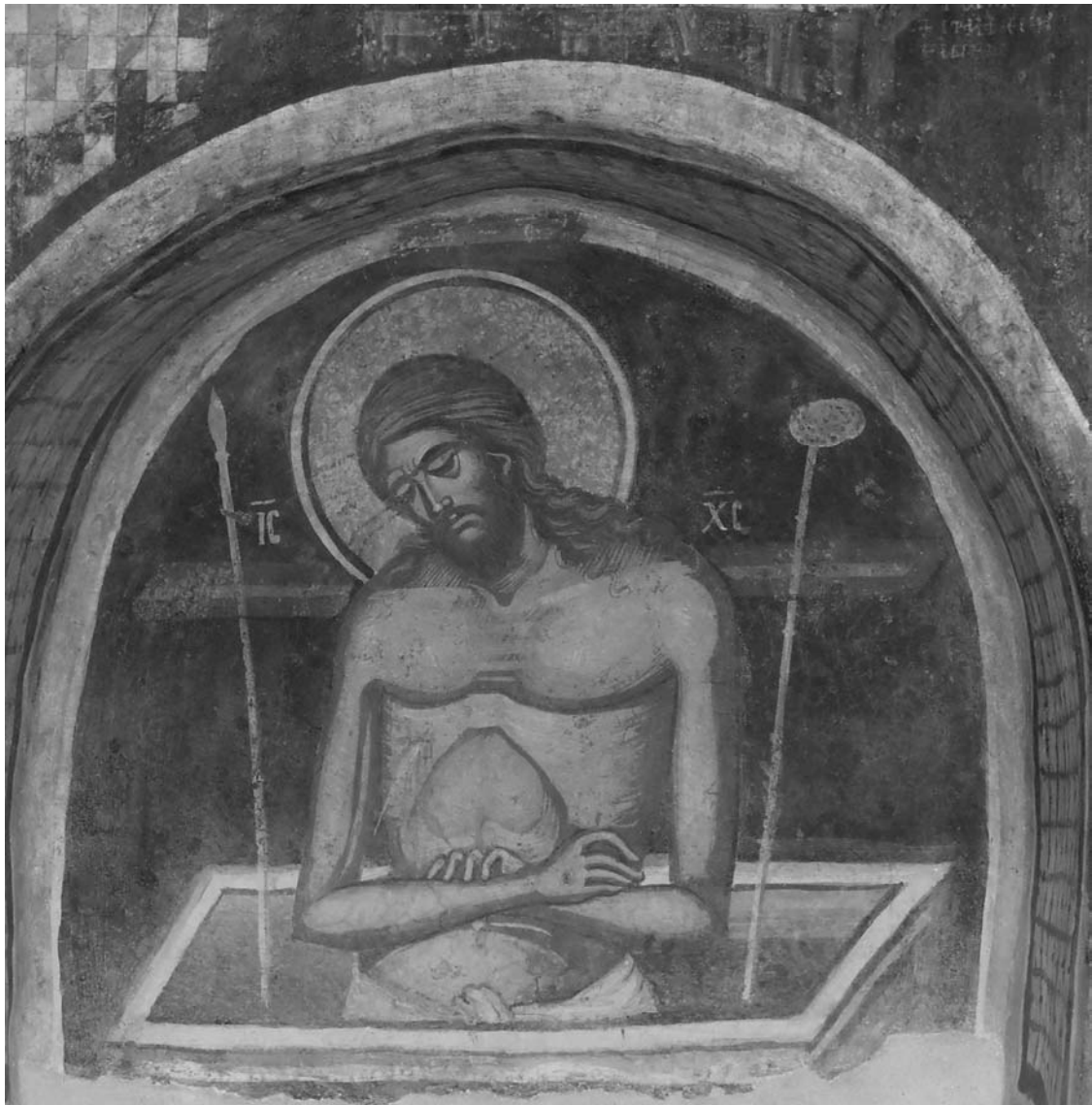
Fig. 6. Iisus în mormânt, proscomidiar.