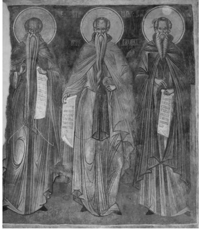
Fig. 20. Sf. Eftimie, Maxim, Ilarion, naos S.