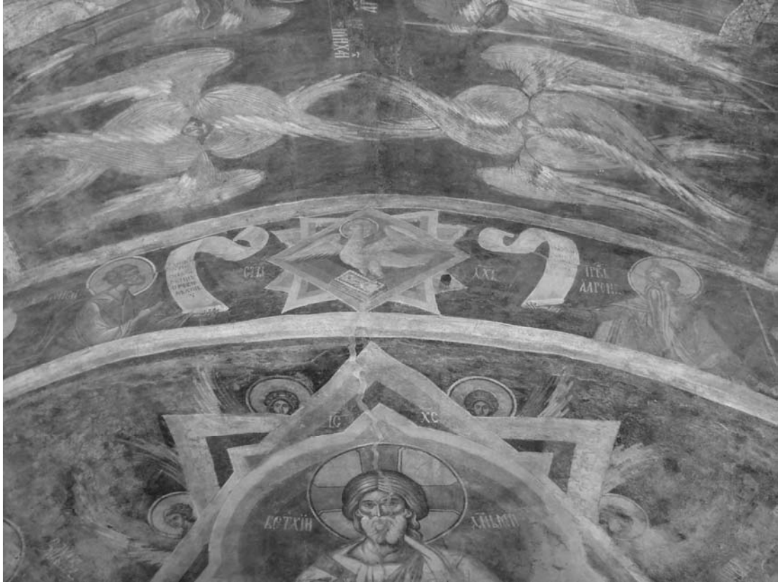
Fig. 12. Sf. Duh, prorocii Moise și Aaron, extradossal bolții altarului.