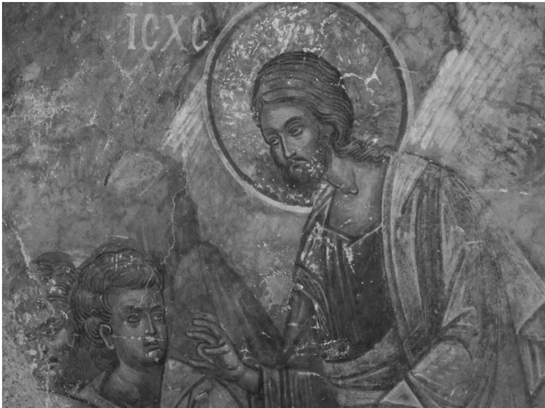
Fig. 17. Schimbarea la Față, detaliu.