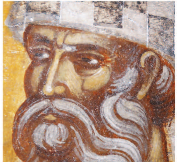
Fig. 10. Sf. Spiridon, detaliu.