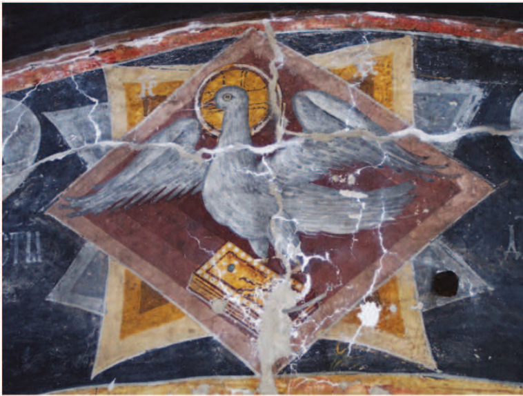
Fig. 13. Sf. Duh.