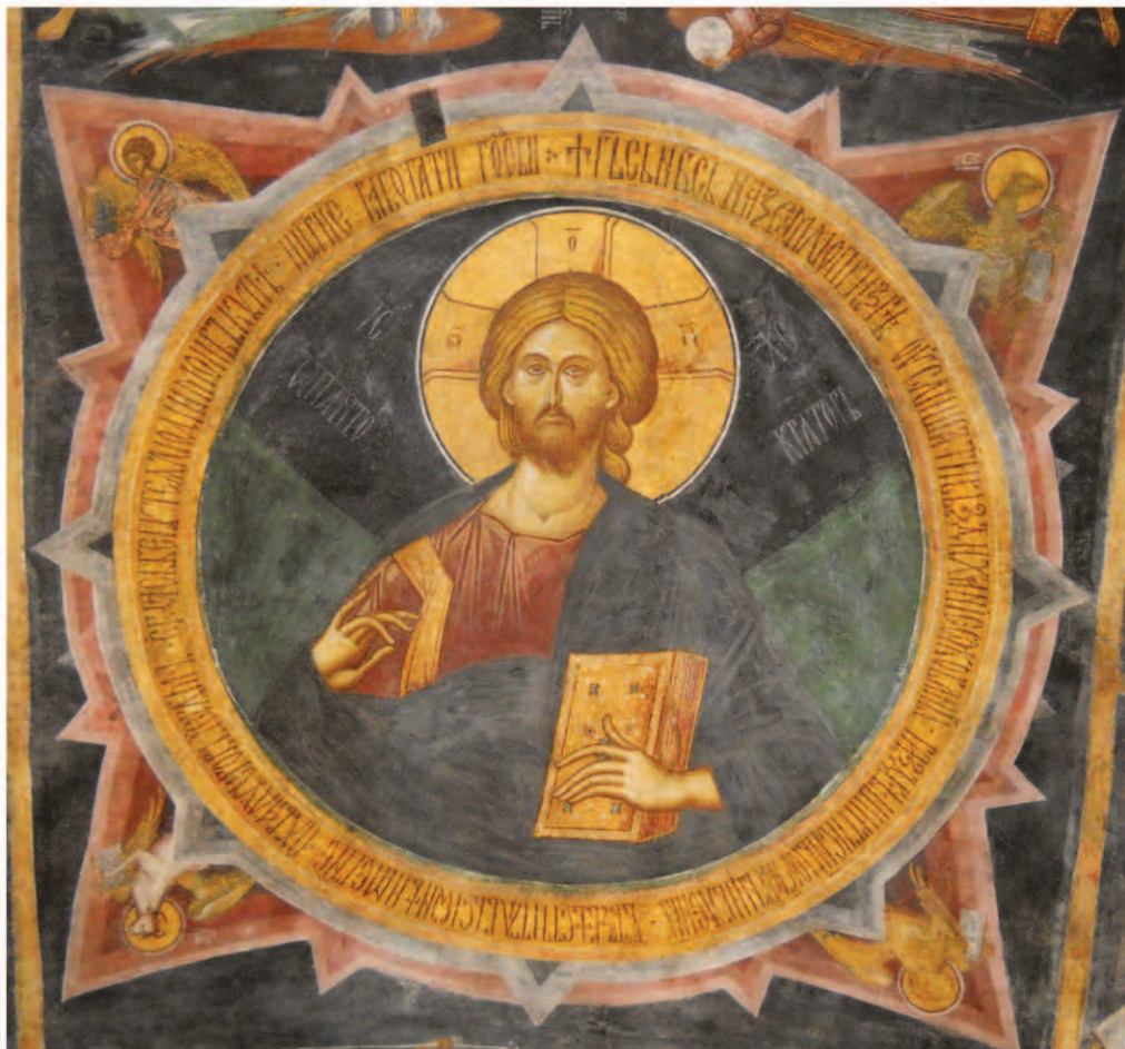
Fig. 14. Pantocrator.