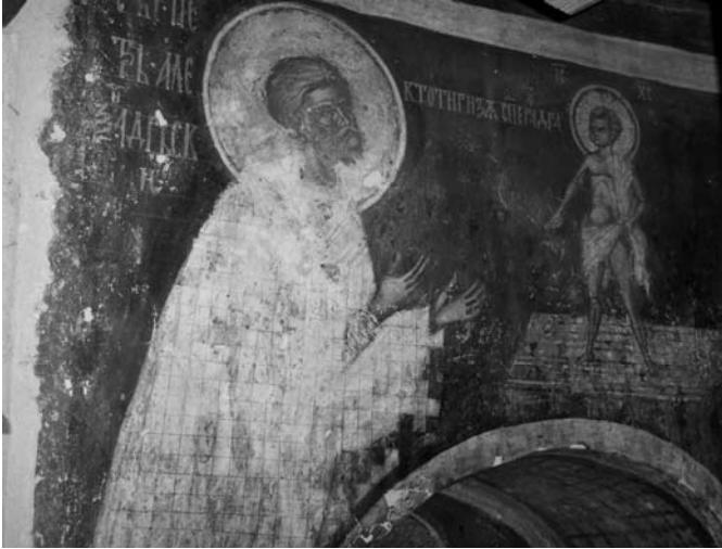
Fig. 4. Viziunea sf. Petru din Alexandria, altar N.