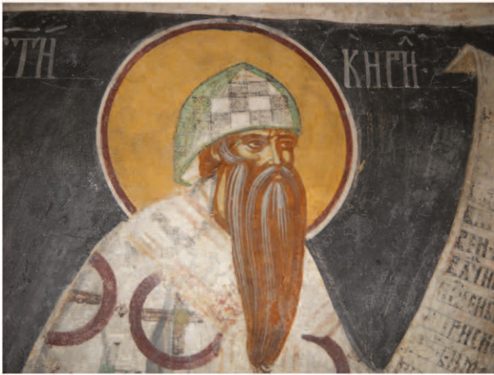
Fig. 7. Sf. Chiril al Alexandriei, altar N.