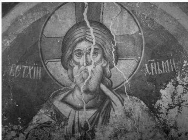
Fig. 1. Cel Vechi de Zile, bolta altarului.