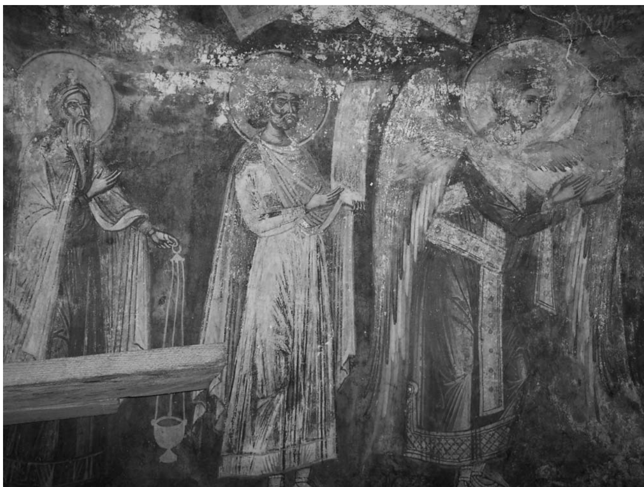
Fig. 3. Prorocul Zaharia, prorocul David, arhanghelul Mihail, bolta altarului.