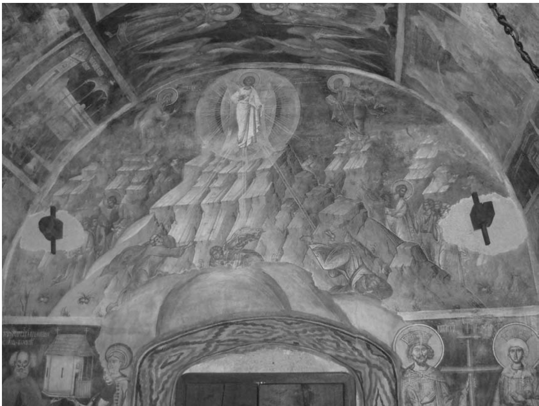
Fig. 16. Schimbarea la Față, naos V.