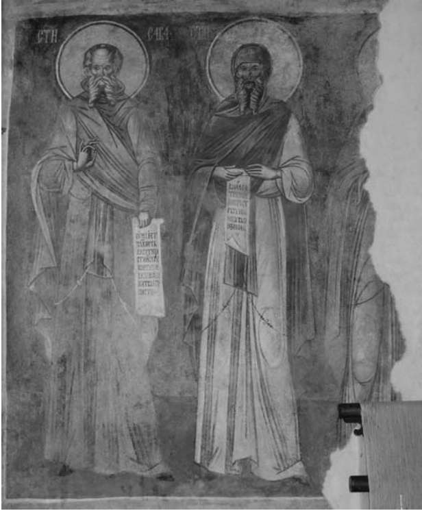
Fig. 19. Sf. Sava și Antonie, naos S.