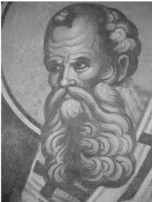
Fig. 9. Sf. Atanasie, detaliu.