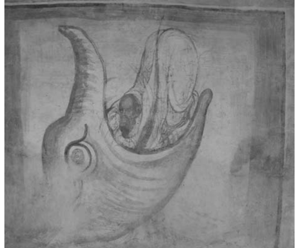
Fig. 5. Viziunea sf. Petru din Alexandria, detaliu: Arie.