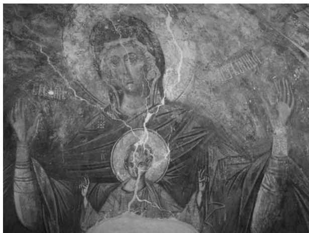
Fig. 2. Maica Domnului cu Pruncul, conca altarului.