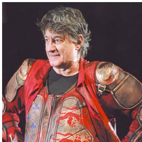
Fig. 2 – Ion Caramitru ( Eduard al III-lea ).

Nu e lipsit de interes a reaminti faptul că protagonistul acestor spectacole a fost Ion Caramitru. Într-un mod oarecum ciudat, creațiile realizate în Hamlet și Creon , roluri fundamentale opuse, se află la baza actualei performanțe. Jocurile puterii politice și, deopotrivă, ale limitelor umane, prezente în evoluția personajelor amintite, domină și interpretarea oferită personajului Eduard al III-lea. Pe lângă această descendență, datele acumulate de Ion Caramitru, atât ca actor, cât și ca om politic și conducător al breslei teatrale, sunt factori care-l desemnează pe artist ca interpret ideal al acestui rol.