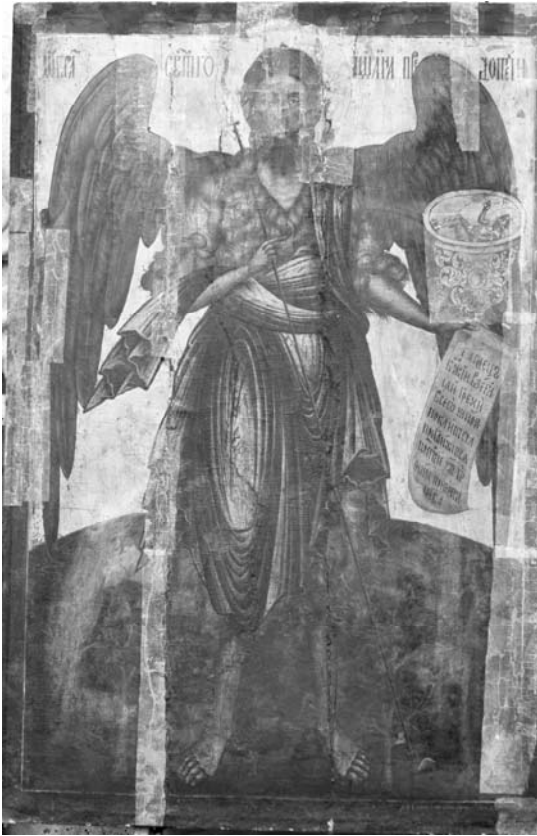
Fig. 9 – Rădăuți, église Saint-Nicolas, iconostase. Petr ?, Saint Jean le Précurseur , icône royale, 1706.