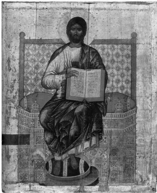
Fig. 5 – Moscou, Musées du Kremlin. Kirill Oulanov, Le Sauveur sur le trône , icône royale de l'iconostase de l'église de la Dormition, 1697/1698.