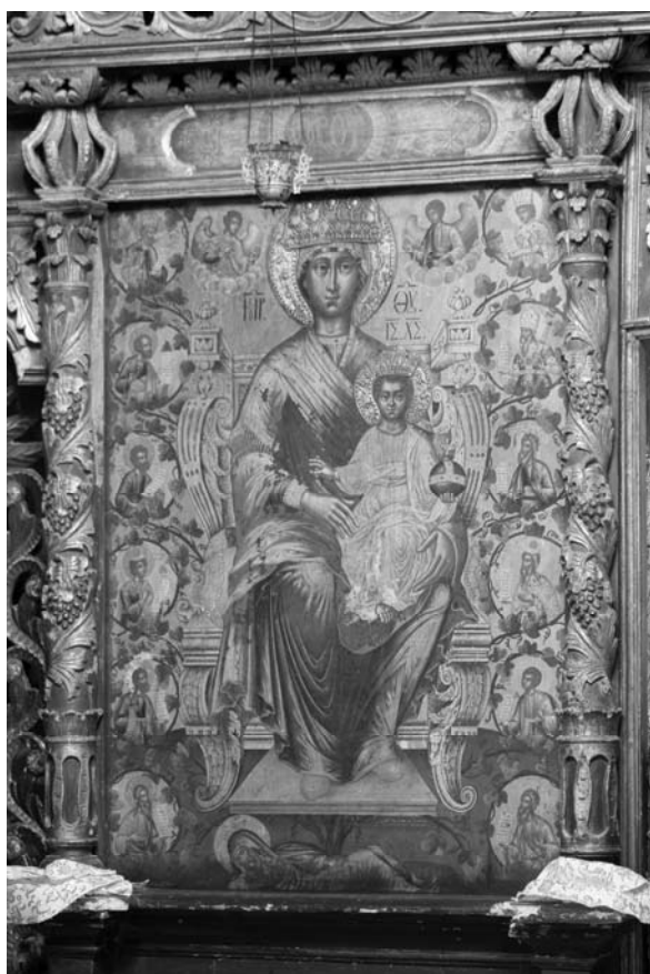
Fig. 11 – Suceava, église Saint-Elie, iconostase. Kirill Oulanov, Vierge à l'Enfant , icône royale, 1708.