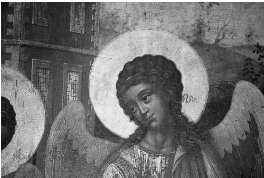
Fig. 17 – Suceava, église Saint-Elie, iconostase. Vassili Oulanov, Sainte Trinité , icône royale, 1708, détail avec l'ange du milieu.

Les icônes de Kirill et Vassili Oulanov avec ses collaborateurs de l'atelier du tsar de Moscou sont des pièces rares en Roumanie. On ne saurait préciser leur destination, quoique les quelques indices iconographiques mentionnés permettent l'hypothèse d'une commande pour la