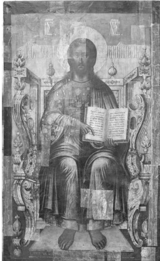
Fig. 4 – Rădăuți, église Saint-Nicolas, iconostase. Kirill Oulanov, Alexei Kvachnine, Pantokrator , icône royale, 1707.