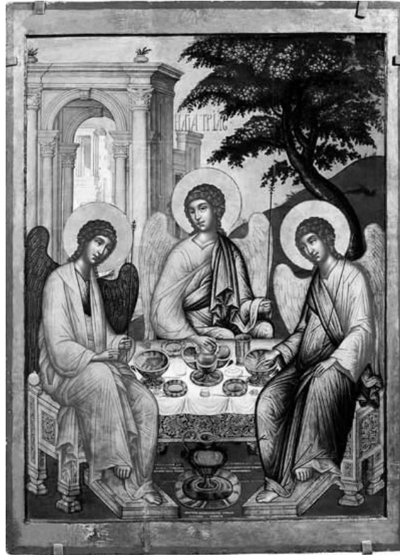
Fig. 14 – Saint-Petersbourg, Musée Russe. Simon Ouchakov, Sainte Trinité , 1671.