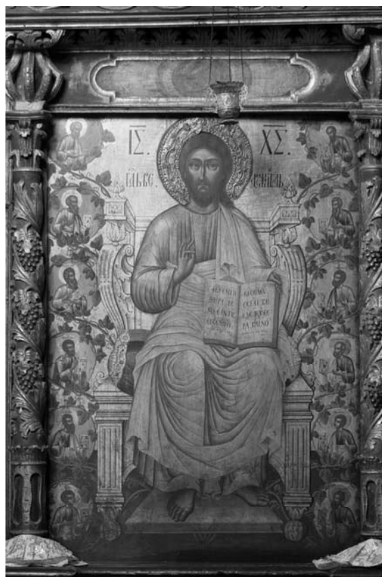
Fig. 12 – Suceava, église Saint-Elie, iconostase. Kirill Oulanov, Le Sauveur , icône royale, 1708.

originaire de Moldavie. La haute qualité de l'art de Kirill est évidente dans les justes proportions des compositions, dans la perfection du modelé des visages et des draperies, enfin, dans l'aspect somptueux des trônes, révélant un comportement artistique analogue à ce qu'on appellera plus tard « académisme ».