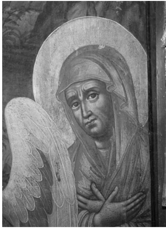
Fig. 16 – Suceava, église Saint-Elie, iconostase. Vassili Oulanov, Sainte Trinité , icône royale, 1708, détail portrait de Sara.