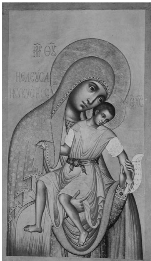
Fig. 1 – Moscou, Galerie Tretiakov. Simon Ouchakov, Vierge Kykkyotissa , 1668.