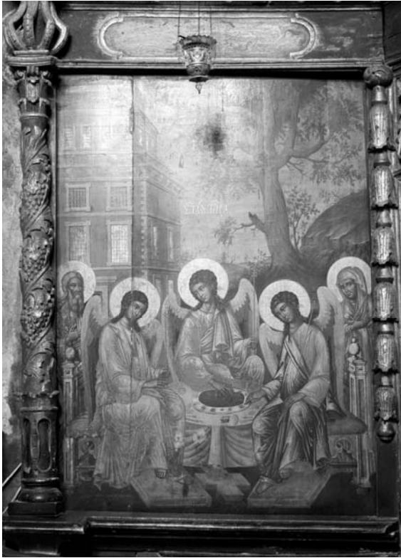
Fig. 13 – Suceava, église Saint-Elie, iconostase. Vassili Oulanov, Sainte Trinité , icône royale, 1708.