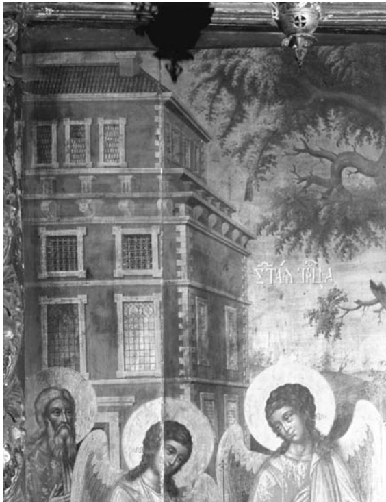
Fig. 15 – Suceava, église Saint-Elie, iconostase. Vassili Oulanov, Sainte Trinité , icône royale, 1708, détail architecture.