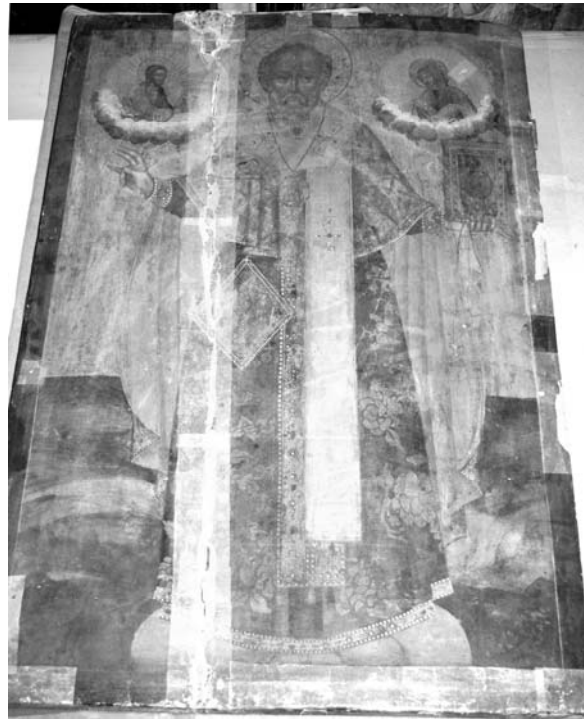
Fig. 10 – Rădăuți, église Saint-Nicolas, iconostase. Anonyme, Saint Nicolas , icône royale, 1707 ?

Les icônes des peintres Kirill et Vassili Oulanov auxquelles nous allons faire référence de suite ont été données par Vasile Gane de Jassy à l'église Saint-Elie du village au même nom, près de Suceava (de nos jours, quartier de la ville), en 1753–1754 17 . Il s'agit de trois icônes royales, réalisées « dans la fameuse ville des tsars, Moscou » 18 en 1708, qui se trouvent dans l'iconostase de l'église, une belle pièce de style baroque vernaculaire dont la peinture semble être réalisée dans un atelier moldave de la deuxième moitié du XVIII e siècle.