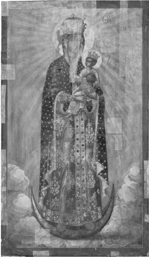
Fig. 7 – Rădăuți, église Saint-Nicolas, iconostase. Kirill Oulanov, Vierge à l'Enfant , icône royale, 1707.