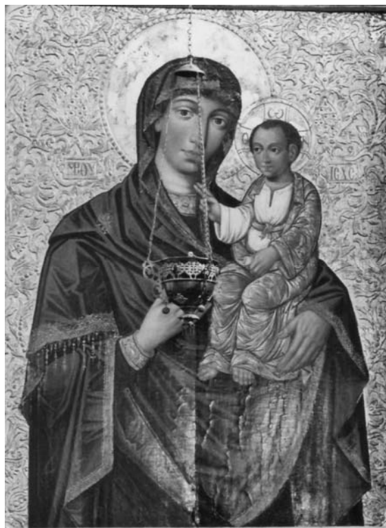
Fig. 2 – Lvov, église Sainte-Parascève, iconostase. Icône royale Vierge à l'Enfant , première moitié du XVII e siècle.

12 roubles en 1689 à 51 roubles en 1701–1702. Les demandes d'icônes adressées à Kirill provenaient de la cour et de la Patriarchie ; de surcroît, il a participé à la « restauration » des anciennes icônes de l'église de la Dormition du Kremlin, parmi lesquelles il y avait, semble-t-il, la fameuse Vierge Vladimirskaïa . Kirill Oulanov s'est retiré au monastère Krivozersk, près de Iourevts-Povolski, où il fut tonsuré en 1709, sous le nom de Kornilij, et il en devindra l'hégoumène, en 1714. Kirill continua à peindre icônes et iconostases jusqu'à sa mort, en 1731, après le décès de son frère Vassili, en 1726.